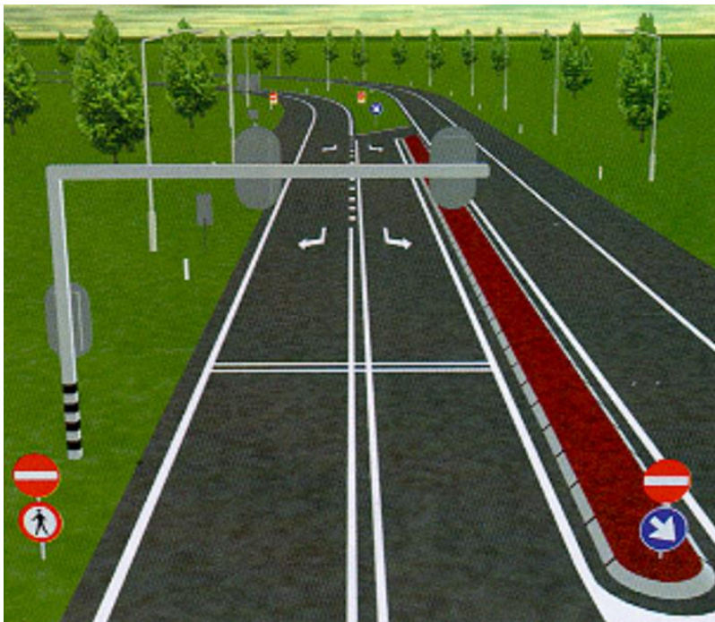
Figuur 3. Correctieweg die ervoor zorgt dat een automobilist die de afrit in plaats van de toerit oprijdt, automatisch naar de toerit wordt geleid. De rijstrook voor verkeer dat afslaat naar links, gaat in de andere richting via een doorsteek over in de toerit (Bron: RWS Zuid-Holland/Grontmij in Brevoord, 1998)

Voor de drie spookrijders die op een halfklaverbladaansluiting de afrit opreden, had een correctieweg ervoor kunnen zorgen dat de spookrijder automatisch via een doorsteek van de afrit naar de toerit werd geleid ( Brevoord, 1998 ). (zie Figuur 3). Daarbij wordt gebruik gemaakt van het gegeven dat automobilisten die onbedoeld spookrijden, meestal op de voor hen rechts gelegen rijstrook rijden, wat in onze studie bevestigd door 34 van de 45 spookrijders.